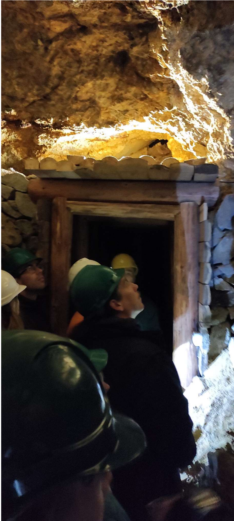
1. ábra: Bányalátogatás Selmecbánya térségében, október 3-án.